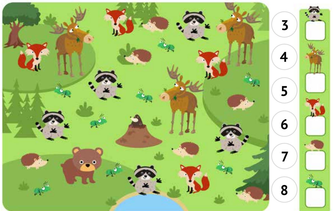
Grafik: AngArt / Adobe Stock; Montage: SoVD

Der Bär schaut erstaunt in die Runde: Es scheint, als hätten sich alle Tiere des Waldes zu einem Treffen auf der großen Wiese verabredet – was für ein Gewusel! Aber wie viele Tiere sind es jeweils? Wenn du die Zahlen von 3 bis 8 richtig zugeordnet hast (streiche die verwendeten am besten durch), dann bleibt eine Zahl übrig – sie ist die von uns gesuchte Lösung. Viel Erfolg!