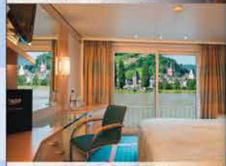
Kabinenbeispiel, 4++ VIKTORIA