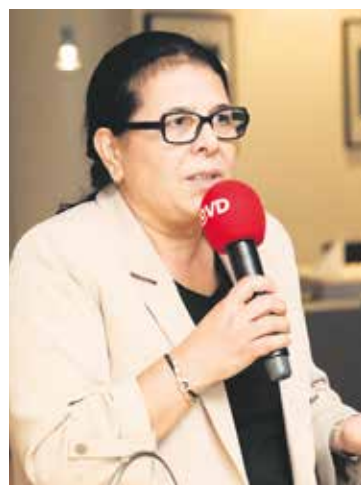
Gülistan Yüksel (MdB, SPD): „Wie schaffen wir es, den Menschen Ängste zu nehmen?“