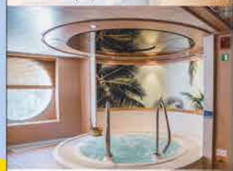
Whirlpool, 4++ DCS Amethyst