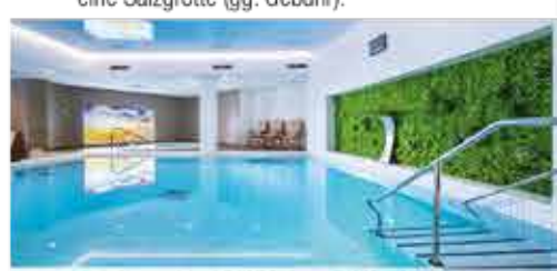
Schwimmbad, 4+ Resort Reitenberger

Freizeit/Kur/Unterhaltung: Das Resort besitzt eine Kurabteilung mit Schwimmbad (9 x 6 m, ca. 29°C), Whirlpool, Saunabereich mit Dampfbad und einem Fitnessraum (kostenfrei außerhalb der Therapiezeiten). Zudem verfügt das Haus über eine Salzgrotte (gg. Gebühr).