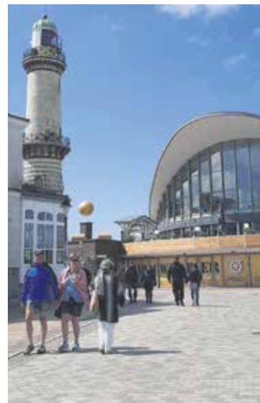
Der Leuchtturm ist das Wahrzeichen von Warnemünde.

Eine rundum gelungene Tagesfahrt, die vom Unternehmen „Reichert Bus & Touristik“ professionell vorbereitet und durchgeführt wurde.