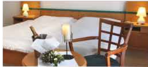
Zimmerbeispiel, 3+ Hotel Maxim

Freizeit/Kur/Unterhaltung: Der Komplex verfügt über einen eigenen Kurbereich, in dem alle gängigen Kur-Anwendungen geboten werden. Des Weiteren steht Ihnen das Schwimmbad (8 x 4 m, ca. 29°C) außerhalb der Therapiezeiten zur Verfügung.