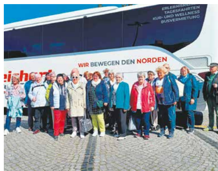
Eine große Truppe: Die Reisegruppe setzte sich aus Mitgliedern und Gästen des SoVD und VdK Schwerin zusammen.

Bei strahlendem Sonnenschein erreichte die Reisegruppe vormittags Warnemünde. Die Teilnehmer*innen hatten ausreichend Freizeit für einen Bummel entlang des „Alten Strom“, für eine Hafenerundfahrt und natürlich für kleine oder große Leckereien. Traditionell orderten viele Mitreisende ein Fischbrötchen. Die einen aßen es, die anderen spendeten es unfreiwillig – denn auch Möwen mögen Fischbrötchen und mutierten dafür zu Raubmöwen. Selbst eine Auszeit im Strand-