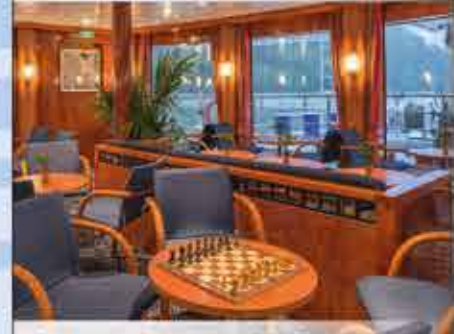
Panorama-Salon, 4++ BOLERO