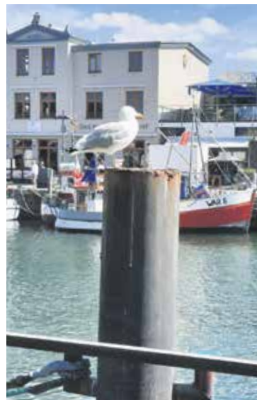
Die Möwen halten immer Ausschau nach Fressbarem.