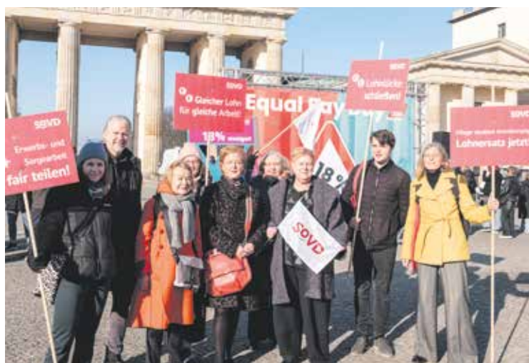
18 Prozent Lohnlücke – der SoVD fordert wirksame Maßnahmen.

Ein riesiges Verkehrsschild mit 18 Prozent Gefälle symbolisierte