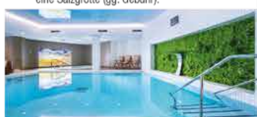
Schwimmbad, 4+ Resort Reitenberger

Freizeit/Kur/Unterhaltung: Das Resort besitzt eine Kurabteilung mit Schwimmbad (9 x 6 m, ca. 29°C), Whirlpool, Saunabereich mit Dampfbad und einem Fitnessraum (kostenfrei außerhalb der Therapiezeiten). Zudem verfügt das Haus über eine Salzgrotte (gg. Gebühr).