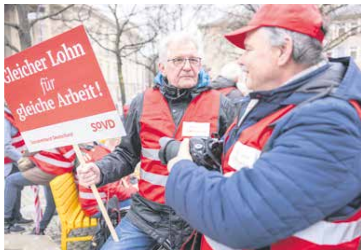
Auch zahlreiche Männer waren unter den Teilnehmenden der Aktion und unterstützten die Forderungen.