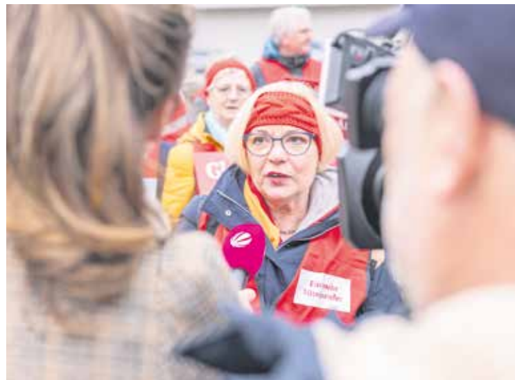
Redakteur*innen von Sat.1 regional und NDR sprachen mit den Demonstrierenden über ihre Erfahrungen mit der Lohnlücke.